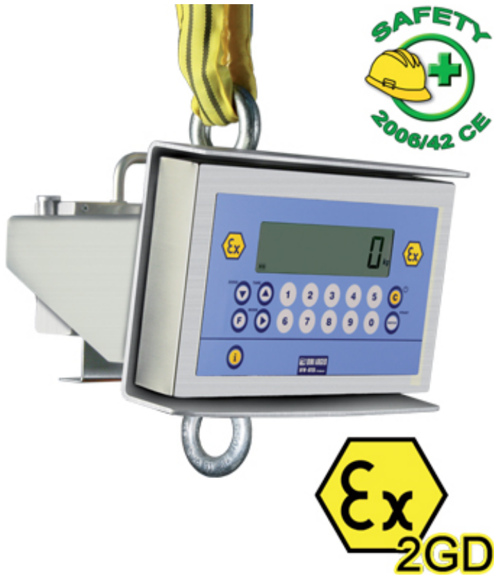
Crochet peseur MCWX2GD.

Crochets peseurs pour les applications de pesage dans les zones à risque d'explosion ATEX (zones 1 et 21, 2 et 22) et répondant à la norme Ex II 2GD IIC T4 T197°C X. Entièrement en acier inox avec degré de protection IP68.