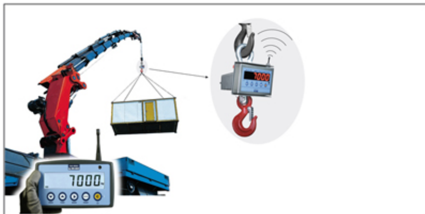
DFWPM : Répétiteur de poids d'une seule balance.